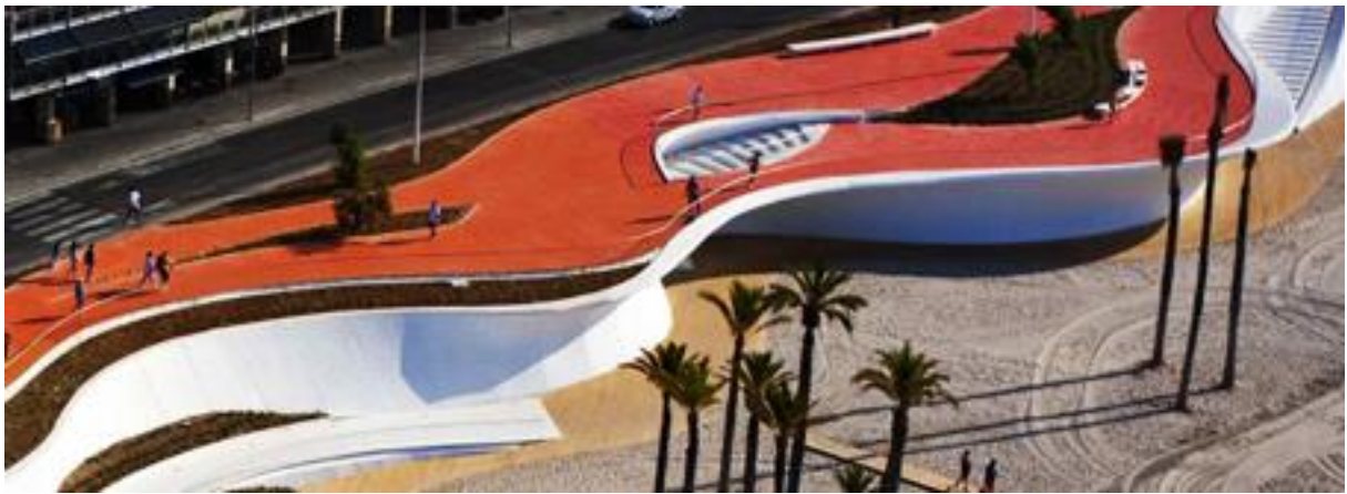
Passeig Marítim Benidorm