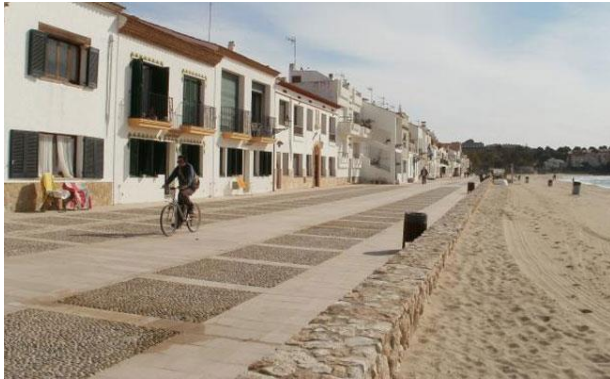
Passeig Marítim d'Altafulla