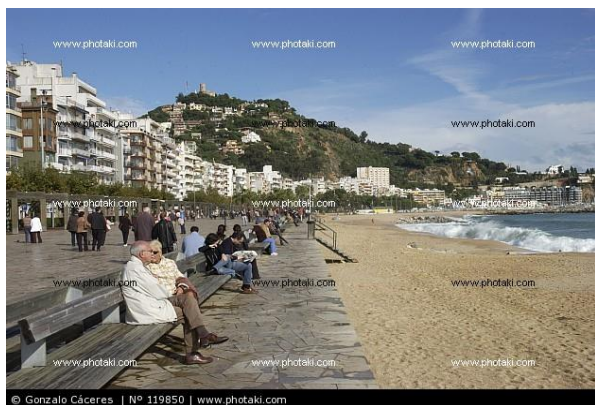
Passeig Marítim Palamós