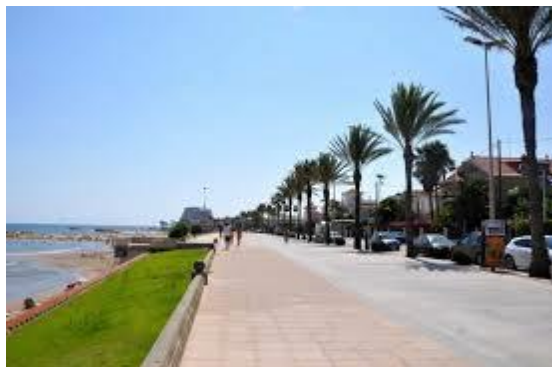
Passeig Marítim Sitges