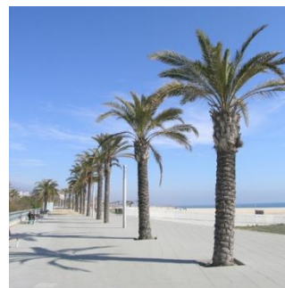
Passeig Marítim Mataró