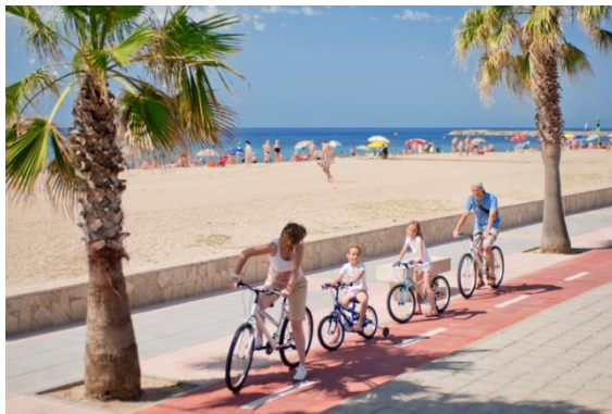
Passeig Marítim Cambrils