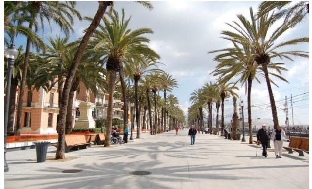
Passeig Marítim Badalona