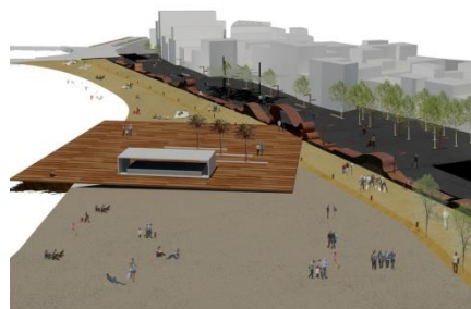
Passeig Marítim Roses