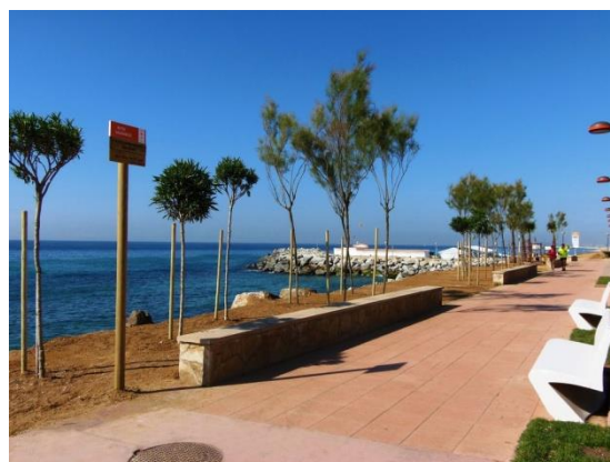
Passeig Marítim Vilassar de Mar