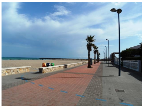
Passeig Marítim de Puçol